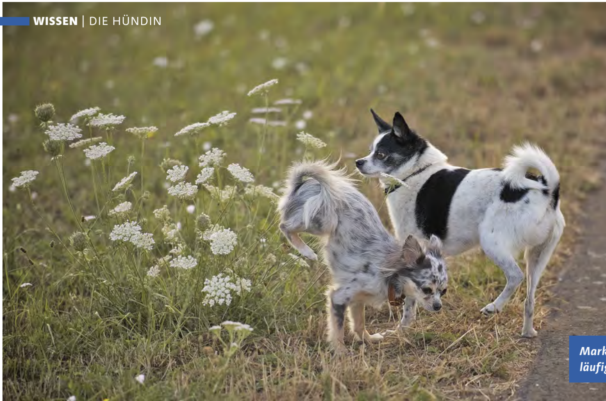
Markierverhalten einer läufigen Hündin.